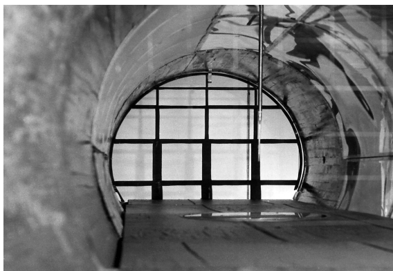
Obr. 1. Veterný tunel Žilinskej univerzity Fig. 1. Wind tunnel of the University of Žilina

The wind tunnel at the University of Žilina was designed in 1965 by M. Pirner [7]. The atmospheric boundary layer in this wind tunnel was simulated in 1970's [8], [9], [10] see Fig.1.