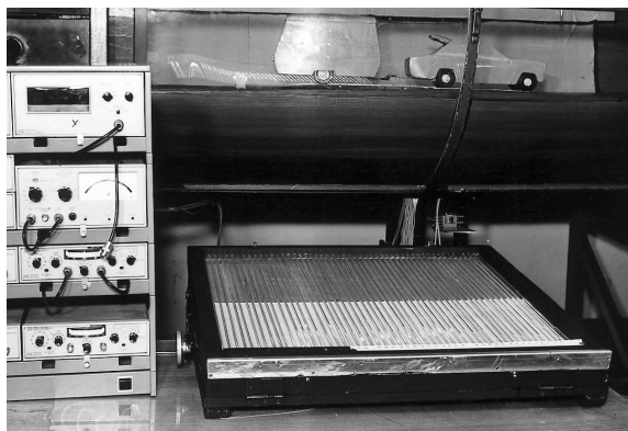
Obr. 3. Model auta s karavanom vo veternom tuneli Fig. 3. Model of automobile with caravan in a wind tunnel of DSM CEF UZ

tures (P. Bystrica 1980, Žilina 1984 and Žilina 1988). The conference on Dynamic of Structures and Wind Engineering was organized also by the Department of Structural Mechanics in Vyhne, September, 2000.