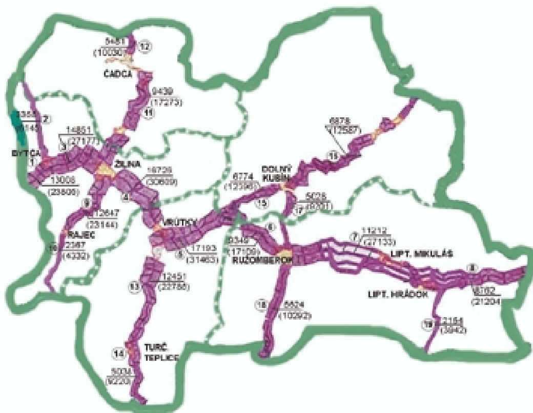
Obr. 2. Intenzita dopravy na cestách I. triedy v sk.v./24h pre rok 2000 (2020) Fig. 2. The traffic volume for 1st class roads in vehicles per day (AADT) for 2000 (2020)

The analysis of the carrying capacity was prepared for evaluating the part of the road network in the region. The integrated parts of the 1st class roads were selected and divided into subsections according to the traffic volume. The maximum traffic volume was calculated according to the traffic census from 2000. The volumes were recalculated for the year 2020 for each section with coefficients of the traffic growth. The obtained values are shown in Fig. 2. The data in parentheses are valid for the perspective year 2020. The number in the circle marks the evaluated subsections.