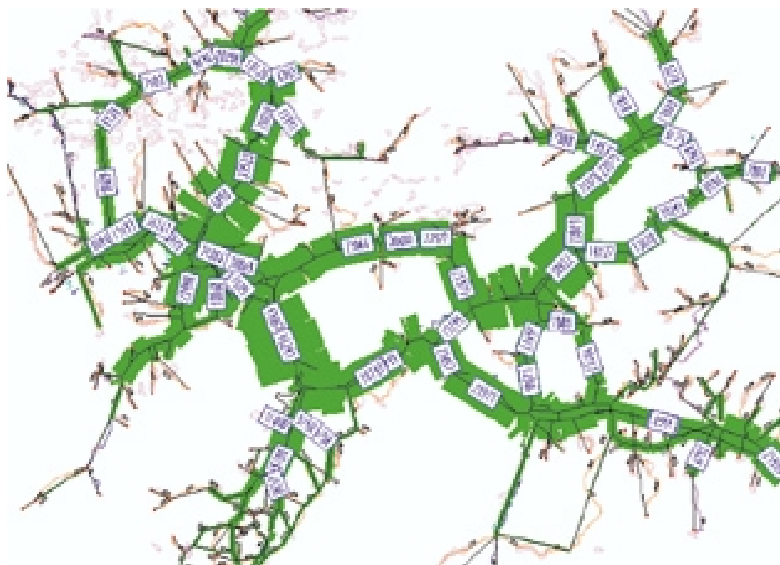
Obr. 4. Zaťaženie cestnej siete kraja Fig. 4. The traffic loading of the road network

The expected load of the roads network was obtained by an equilibrium procedure of the trip assignment after calculating the O-D matrixes (Fig. 4). The calculated traffic load of the network almost achieves the level observed in 2000 in spite of the through traffic volumes absence. Whence it follows that the deterrence function used in the VISION software does not correspond completely with Slovak conditions. The model values excess also data obtained by a gravity method, namely for the private transport. In case of the public transport the data are comparable. Therefore it is necessary to pay attention to the model calibration for the VISUM software in future analyses.