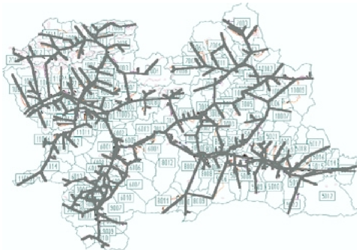
Obr. 3. Základná cestná sieť kraja Fig. 3. The basic road network in the region

The modelled traffic relations were distributed to the road network in the region with a reduced number of urban agglomerations. The outer area was divided into the neighbouring counties, regions, and countries by routing the transport networks. Only the data concerned Žilina region in the form of the origin or destination traffic were used for calculation. The destination traffic from other regions and through traffic from Považská Bystrica and Prievidza were not evaluated because of lack of information. This fact caused a partial under dimensioning of the regional traffic loading. The basic regional roads network is shown in Fig. 3 [4].