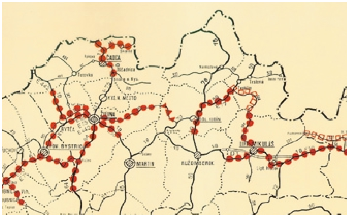
Obr. 1. Kritické cestné ťahy kraja Fig. 1. The critical trunk roads of the region

Nr. I/18 belongs to the critical trunk roads of Slovakia from the point of view of accident rate. The sections of the roads Nr.I/61, I/64, I/11, II/487, II/507, II/583 and II/584 belong to the critical trunk roads in Slovakia, too (Fig. 1). One critical trunk road of the regional importance also exists in the area [2].