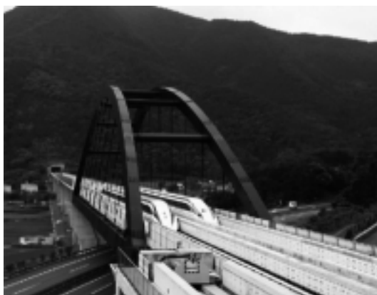
Obr. 1. Dva protiidúce vlaky MLX01 na skúšobnej trati maglevu v Yamanashi Fig. 1. Two passing trains MLX01 at Yamanashi Maglev Test Line

The Yamanashi Maglev Test Line (YMTL) was opened in 1997 near Tokyo. The MLX01 maglev vehicles have been tested on this 42.8 km-long line where the new world record speed of 552 km.h -1 was marked for a single train and the relative speed of two trains passing each other at